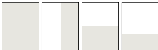
½ strony 208 x 255 ½ strony 100,5 x 255 ½ strony 208 x 127,5 ⅓ strony 208 x 86,5

Wydrukowane ogłoszenie może różnić się kolorystycznie od wydruku próbnego o \Delta E_{ab} = 5 .