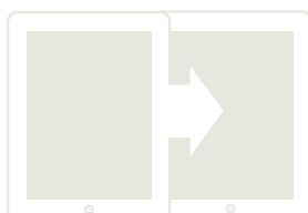
Dwie strony konsekwentne